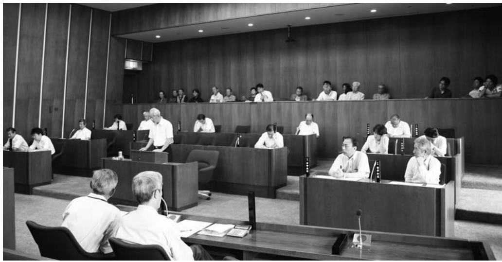
23名の住民が傍聴した今年で8回目の日曜議会(6月14日)