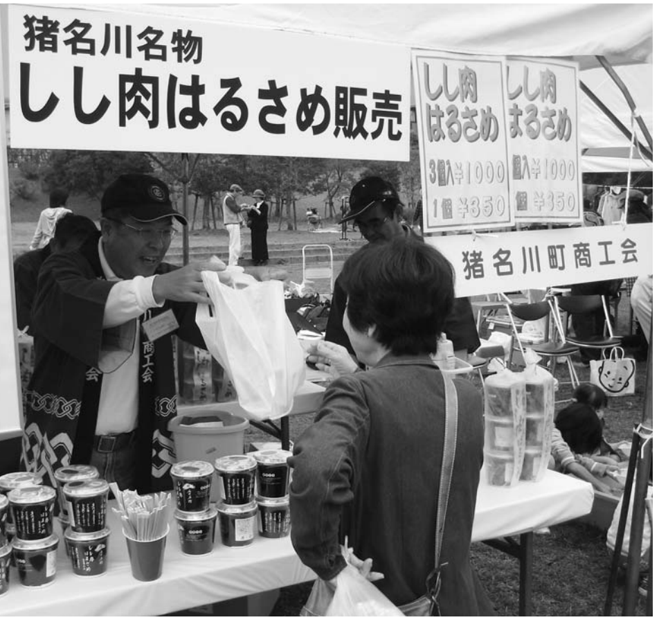
商工会による「しし肉はるさめ」の販売(昨年のいながわまつり)