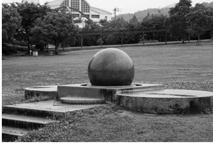
回らないグラニットボール（総合公園）

川西市の議員と連携して「猪名川町のふれあいバス乗り入れ」について質問通告したが、川西市では「具体的な調整に入りたい」と答えている。川西市と協力して問題点をクリアし、一日も早い乗り入れ実現を。 総務部長 川西市の答弁