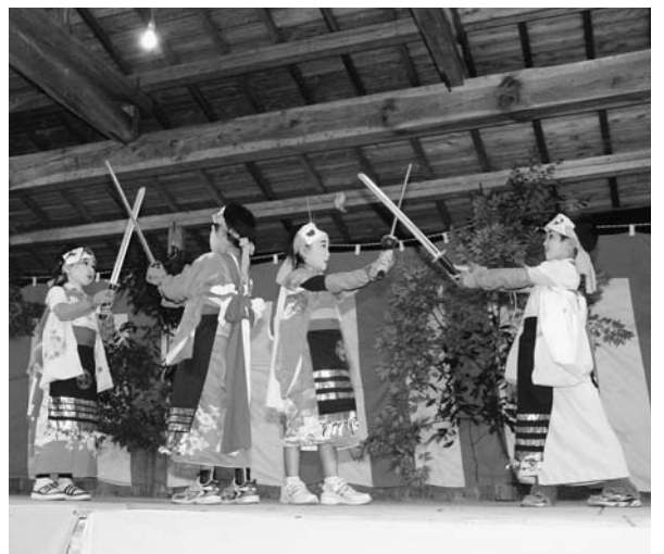
杉生・西畑地区の「練り込み」

小中学校の新しい学習指導要領が公表され、伝統文化の尊重や言語力育成等を重視して、実際の授業に活かしていきたい。また、伝統文化の尊重は、指導要領の大きな特徴であると思う。先人の生き方や、文化遺産等の学習を通して、国や郷土の歴史について学ぶ事は非常に大切な事であると思うが、当町としての取り組みは。