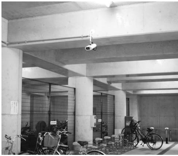
自転車駐車場内の防犯カメラ（伏見台）

日生中央駅第2自転車駐車場周辺のセキュリティの対応策として、防犯カメラの設置としては。