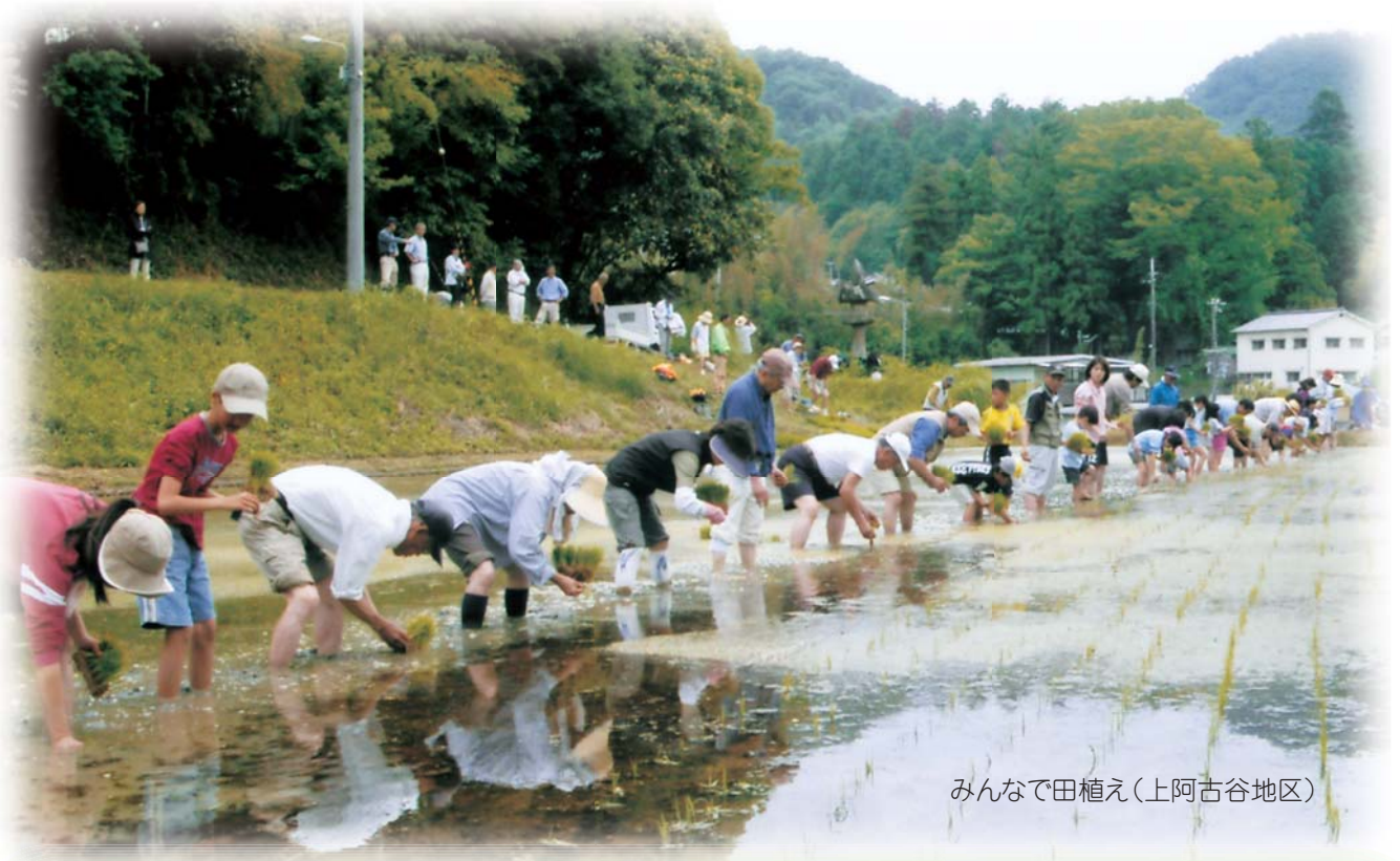
みんなで田植え(上阿古谷地区)