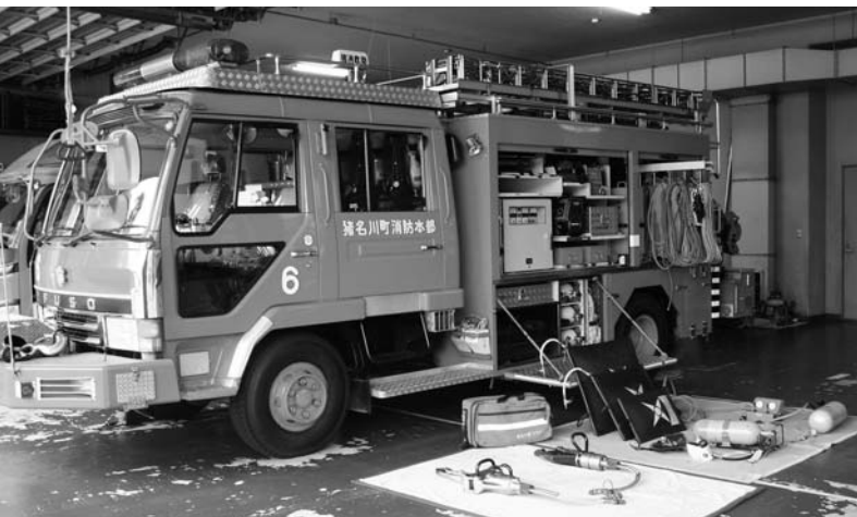
◀救助工作車と資器材