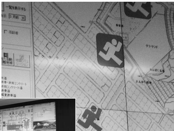
防災支援システム (水道庁舎内)

供など、非営利で公益性の高い事業展開を行っているが、木材価格の低迷などにより、採算性の高い事業展開は厳しい状況にある。 農業を守り、活用していくために今後どのように指導、また、目指そうとしているのか。 建設部長 農業者の高齢化・担い手不足のための対策として、規模拡大希望農家や認定農業者への農地の集積、集落営農の推進、市民農園の開設など地域の実情に応じた取り組みをしていく。