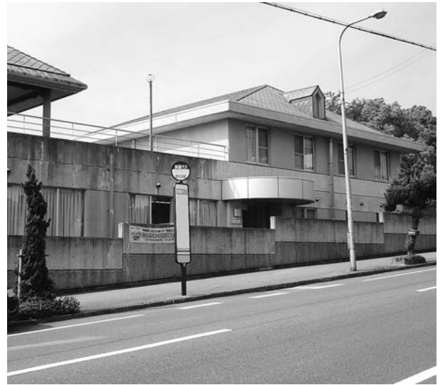
近隣市内のコミュニティ施設

生活部長 本町は準備金を全額取り崩し、21年3月に4200円になるところを4000円に据え置くことができた。 教育部長 食品添加物は学校給食センター運営委員会で検討しており、カラギーナンも含め研究を進めていく。 宝 本町の学校給食の食品添加物の基準は安全か。 全国の介護保険料が3800億円も赤字になっている。サービスの利用が少ないのも問題だが、料金の値下げに充当するべきではないか。