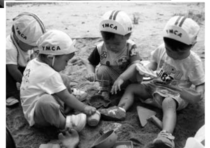
YMCAまつおだい保育園の様子