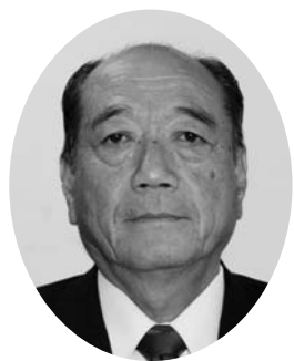
議長 南初男(7期目) 議長、副議長、議会運営 委員長などを歴任