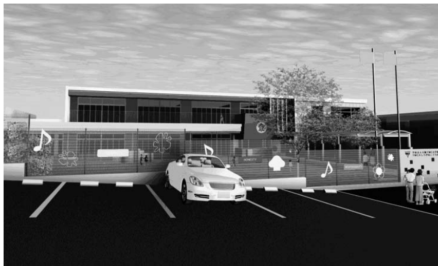
YMCAしろがね認定こども園 (完成予想図)