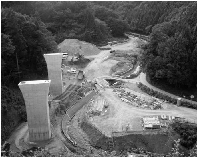
工事が進み、今後環境問題が注目される新名神