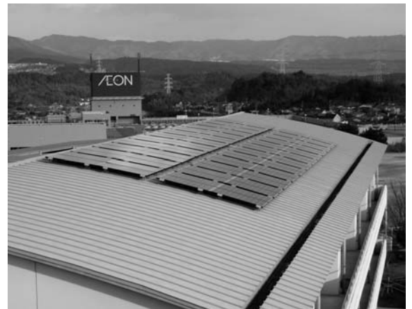
学校に設置された太陽光パネル（白金小学校）

代替エネルギーは、東日本大震災で被災した福島原子力発電所の放射能漏れで一気に見直されてきた。日本中の原発を止め、電力はまかなえると言われていた。太陽光発電やエコ給湯器、ソーラー蓄電池などへの補助をすべきでは。 まちづくり部長 本町も14年〜20年まで太陽光発電に補助をしていた。今後国・県・各自治体の動向を見据えていきたい。 避難場所にもなる体育館は、夏は暑く、冬は寒い。