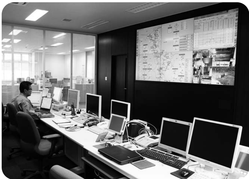
水道庁舎内の中央監視所

Q 農業共済条例の一部改 正・町道路線の認定につ いても審査。いずれも全 会一致で認定・可決