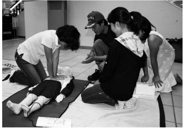
心肺蘇生法を受講中の児童たち

子ども救命士は、小学校高学年を対象に、消防本部の職員が応急手当や心肺蘇生法などを教えるカリキュラムを設け、全講座を受講した子どもを認定するもの。 生命の大切さを理解してもらうとともに、救命の知識も身につけてもらい、大人になった時に役立てて、市民の救命率向上につなげていけるが、本町の考えは。 消防長 小学生の授業に取り入れていくには、消防本部の人員整備をする必要があり、国の動向を