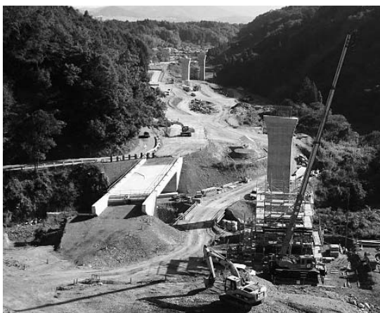
宝塚市側から猪淵方面を望む (写真中央の橋は県道切畑猪名川線の西ヶ平橋)

A 非常に大事であると認識している。ただ、用地買収が100%でないため地権者に配慮しながら努力している。