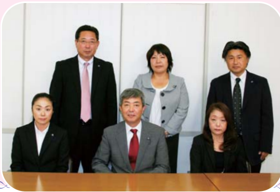
私たちが編集しています。

長く暑い夏が終わり、やっと秋らしくなりました。町議会議員選挙も終わり、議会広報特別委員会のメンバーも大きく変わり、6人の委員中4人が新人議員で構成されました。これまでの編集方針を受け継ぎながらも新人議員の新鮮な発想を取り入れて、なお一層読みやすく分かりやすい紙面構成にチャレンジしてまいります。引き続きのご愛読をお願いいたします。