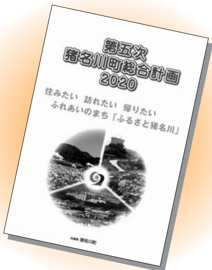
昨年4月から始まった総合計画

構想を見直す場合がないとも限らないが、その場合は議会とも相談し、必要な手続きを経て、見直しをしていきたい。また、3年後には、後期基本計画の時期となる。そのとき報告をしたいと考えている。