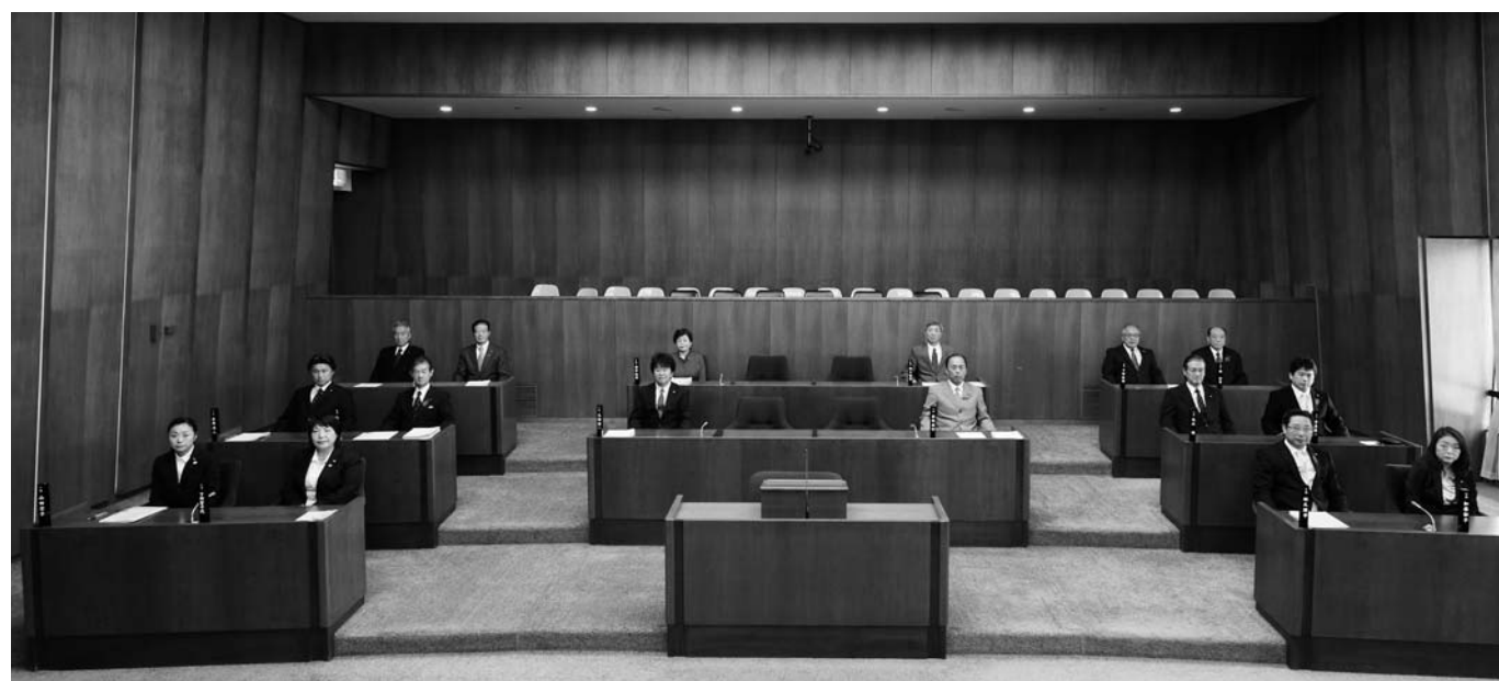
住民の代表16人が決定、新体制でスタート