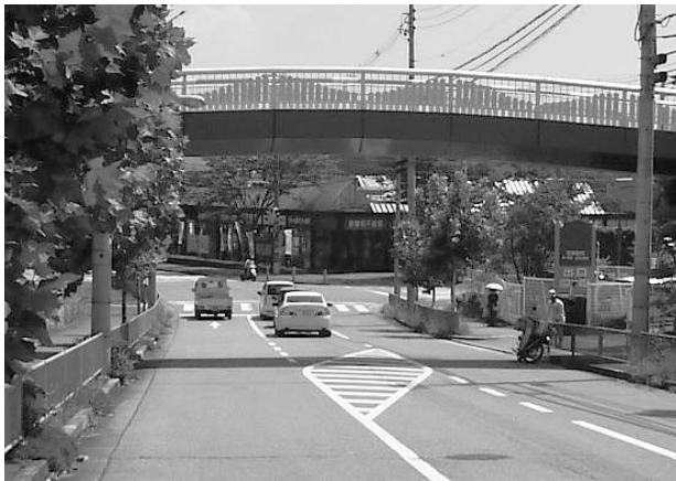
右折しにくい交差点

見ながら、教育委員会・消防本部と調整し検討していきたい。 今、全国の図書館で視覚障害者や高齢者用に、拡大読書器の設置が始まっている。この読書器は、文字の大きさを最大約60倍まで拡大できるものである。本町でも設置を考へては。 教育部長 ルーペ・老眼鏡を使用する方がほとんどだが、今後は図書館のサービスをより充実させるため、拡大読書器の拡充が必要な時には検討していきたい。