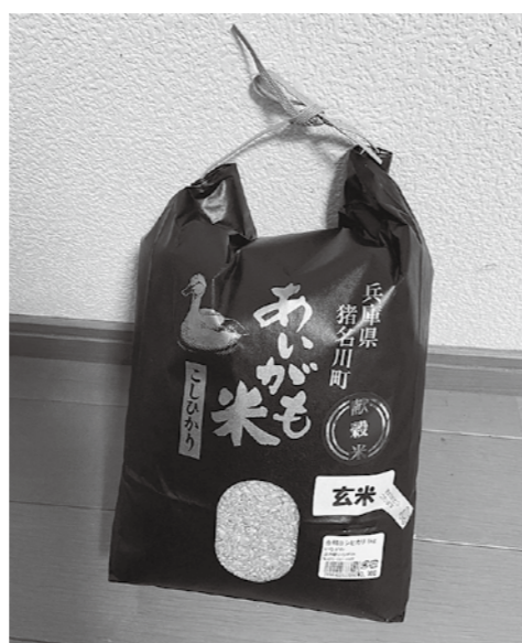
あいがも米(道の駅いながわで販売)