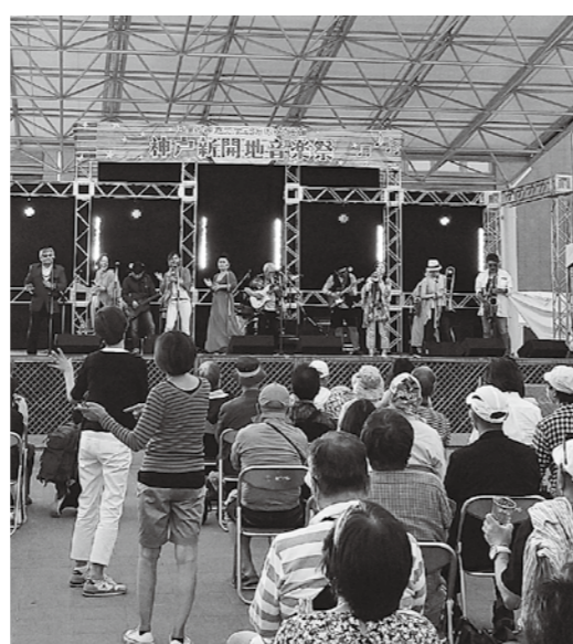
多くの人を魅了する音楽祭

5月11日、南田原自治会を対象に現況説明会を開催しているが、なぜ多くの住民に向けた説明会の開催を考えないのか。 地域振興部長 住民への周知は町広報、ホームページ、町長の動画などコロナ禍をふまえ知ってもらうよう努めている。 コロナの関係と云うが、昨年8月にも南田原で説明会を行っている。要望すれば開催するの。 地域振興部長 多くの住民に向けた説明会は前向きに検討したいが、住民訴訟が提起されており、これらの関係性や影響をふまえ慎重に対応したい。