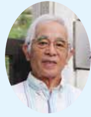
楊津小学校安全ボランティア