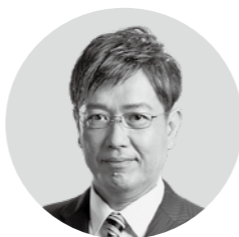
山下 修 議員