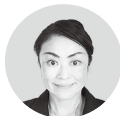
山田 京子 議員