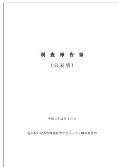
公表している報告書

道の駅いながわ機能拡大プロジェクト検証委員会 調査報告書 第1 事業用地を先行取得したことについて 道の駅事業の推進派であった当時の町長の政策的立場を前提とすれば、道の駅事業を進めるために、町が民間事業者の決定前に事業用地を取得することを判断したことは、必ずしも不合理な判断であるとはいえない。事業用地の取得にあたっては、町議会において相応の議論がされた上で議決を経たことからすれば、民間事業者の決定前に事業用地取得を先行するこの町