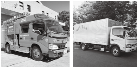
消防ポンプ自動車 給食配送車