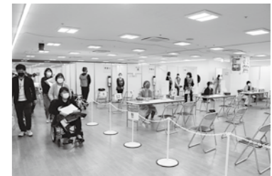
ワクチン接種会場

使用分を減免6千万円(それぞれ20㎡が上限) ・ワクチン接種医師報酬費など、接種対策費4761万6000円。 ・ワクチン接種会場設置等業務委託料など、接種体制確保事業費1億1449万5000円。 ・感染症療養者支援物品配送等業務委託料700万円。 ・子育て世帯生活支援特別給付金事業費2126万4000円。 ○高齢者外出支援100万円。 ・70歳以上の高齢者に、文化体育館事業の半額を助成するもの。 ○情報教育推進環境整備事業費393万1000円。 ○オンライン配信用のタブレットを購入。 ○情報公開事務費 個人情報保護条例改正作業委託料385万円。 ○ふるさとゆかりの偉人マンガ製作活用事業300万円。(P4参照) ○総合福祉センターのシャワーの温水装置などを修繕320万円。 ○社会福祉会館屋根の修繕127万6000円。 ○新型コロナウイルス感染症防止などのため、いながわ桜まつり(303万円)、敬老会(318万2000円)を中止することにより、621万2000円を減額。