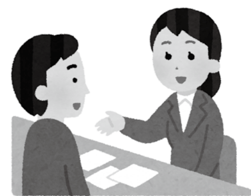
移動することなくお悔やみの手続きが可能

ホームページなどで引き続き細やかな情報発信に努めたい。 国民健康保険における葬祭費の支給条件は、ホームページ上で「会葬礼状」「葬祭費の領収書」と記載があるが、支給は葬儀を執り行ったもの前提でされているのか。 生活部長 葬儀などを一切行わない場合には支給されないが、「偲ぶ会」や「火葬のみを行う場合」など、できる限り広く解釈し、支給している。昨年度も亡くなった人全てに支給している状況である。