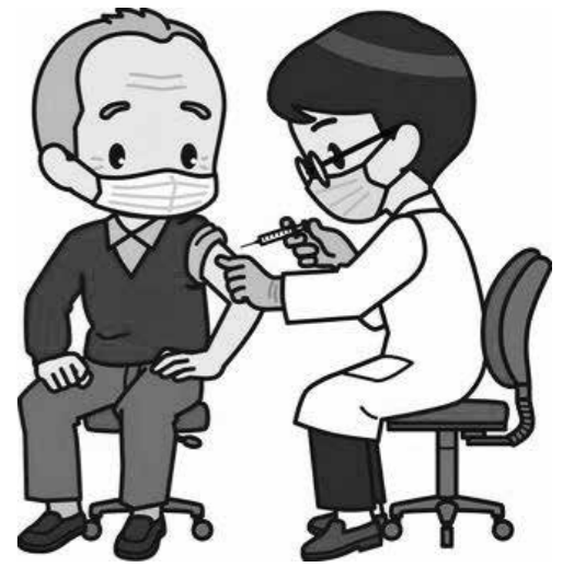
本町はコロナワクチン廃棄せず

6月13日、委員会を開会し、付託3議案、請願1件を審査。主な質疑は次のとおり。 4年度一般会計補正予算 ◎ 県内でコロナワクチンを15万回分廃棄したこと。本町の状況は。 A 本町で現在保管しているワクチンは、廃棄せずに運用できる。 ◎ 新型コロナウイルス感染症対応地方創生臨時交付金は残っているのか。今後の活用は。 A 当初予算や今回の6月補正予算までに充当した金額を差し引いて、通常分は約3000万円、物価高騰対応分は約15