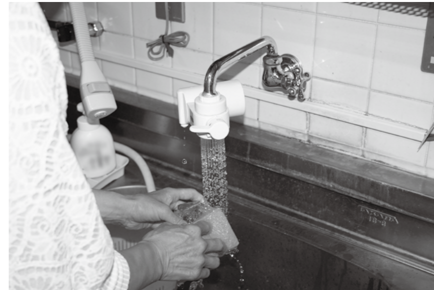
水道料金1か月20㎡(上限)8月・9月分減免

6月9日から23日まで15日間開会し、専決処分4件、補正予算1件、条例制定1件、条例改正1件、動産購入3件、請負契約1件を審議。いずれも全会一致で原案のとおり可決した。 このほか請願2件を審議し、採択した。 一般質問は11人の議員が行った。