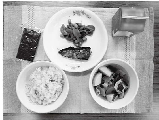
値上げが心配な給食費

給食費無償化は小学校から段階的に行うと公約しているが、コロナの関係で財政的にも厳しい状況となっている。国の交付金を使って給食費値上げがないようにすべきでは。 【 教育部長 】交付金活用で物価上昇による家計負担にならないよう抑えたい。 町長は、道の駅移転は凍結、町の弁護士や監査に對しても疑念発言と言いつつ、昨年10月1日に道の駅の事業用地の取得時期などを検証するため、第三者委員会を設置する専決処分をしたが、不承認となった。516万円の公金