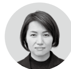
井戸 真樹 議員