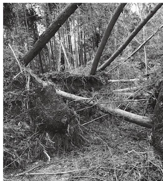
災害後は整備が難しい森林