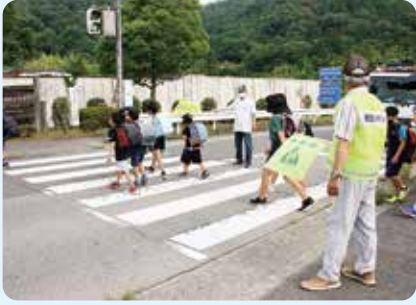
楊津小学校児童を毎日見守り