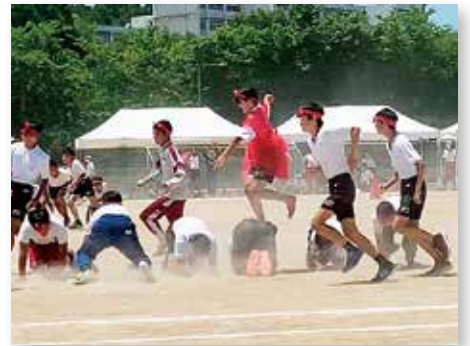
演目「崖の上のポニョ」(清陵中学校)