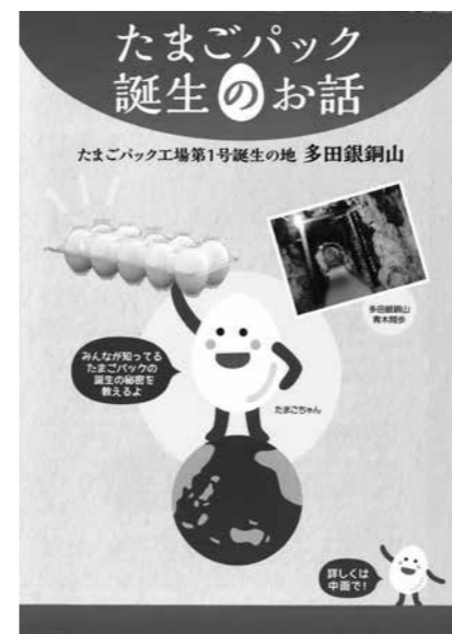
たまごパック誕生の地

のづくりの工夫を学ぶ機会として教育現場で活用したいと考え選定した。 ◎ スクールサポートスタッフの業務内容や従事による教員免許は。今後配置するのか。 A 配布物の印刷や仕分け、消毒作業などで教員免許は不要。教職員の超過勤務解消に向け来年度以降も各校に配置予定。 ◎ アフターコロナを考えた敬老会のあり方は。 A 今年度は接種会場になるため中止したが、次年度以降は老人クラブへの説明で意見をもらいながら検討したい。 (全会一致で可決)