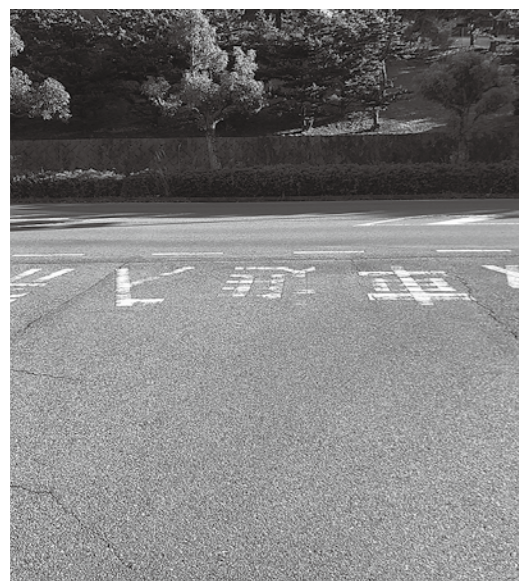
消えかけた路面標示

駅前交通広場は一般車両進入禁止であるにもかかわらず、最近駐車やUターンが多いが。 まちづくり部長 町が要綱により管理し、進入禁止看板を2箇所設置しているが、路面標示の一般車両進入禁止が一部見えにくい箇所があるので、塗り直しなど安全対策に努める。 チヨイソコ利用者は高齢の人が多く、昨年9月議会でも質したが、日生駅前待合場所にベンチを設置できないか。 まちづくり部長 利用者にとって使いやすい交通を考え、必要に応じて整