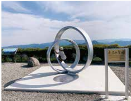
ハムスターのような? (大野山)