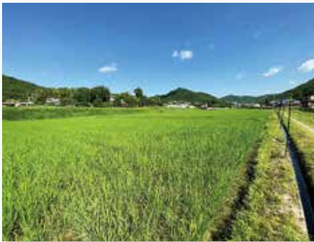
コシヒカリ成育順調! (笹尾地区)