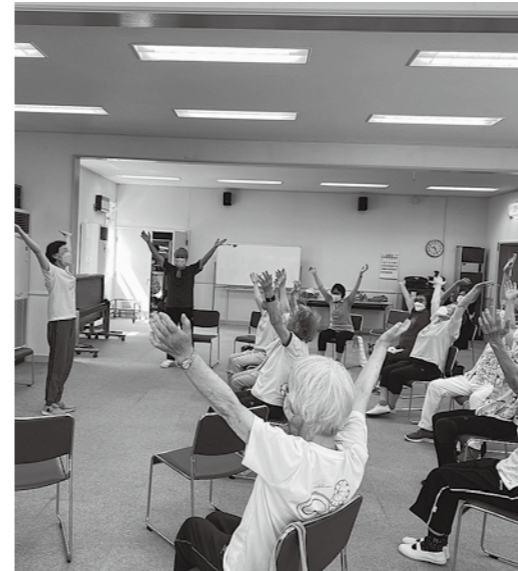
若葉いきいき体操教室

健康長寿体操はフレイル予防に大きな役割を果たしているが、講師料助成金が3分の2から変更になり、6年目から2分の1、9年目以降は4分の1に削減。健康長寿のまちをつたっているのに、長く続ける程助成金が減るのはなぜか。逆ではないのか。 【 生活部長 】限られた予算の中で自主的な運営促進を図り、裾野を広げたい。助成制度については、各教室の状況や希望を聞き、必要な支援を講じたい。 ヤングケアラー本人の負担軽減につながるサービスを周知するハンドブックなどの作成や、空き教