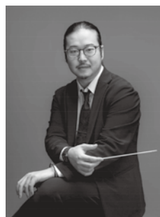
そりた きょうへい 反田 恭平

プロフィール 第18回 ショパン国際ピアノコンクールで日本では半世紀ぶりの第2位を受賞