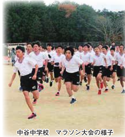
中谷中学校 マラソン大会の様子

す。 ※猪名川町立中学校再編計画は教育振興課窓口、町ホームページで閲覧できます。