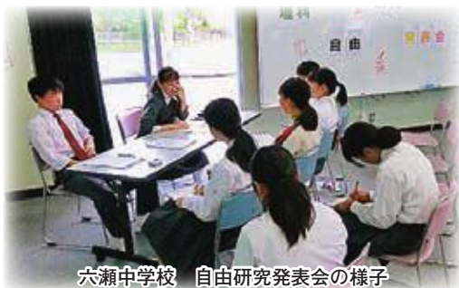
六瀬中学校 自由研究発表会の様子