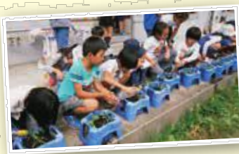
野菜を育てよう！（松尾台小学校）