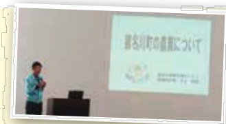
JA兵庫六甲猪名川営農支援センターによる猪名川町の農業についての講演（白金小学校）

地域で生産された野菜は、地域で消費する「地産地消」。町内産の野菜は新鮮です。また、私たちが購入することで猪名川の農業を元気にします。みんなで地産地消の輪を広げていきましょう。