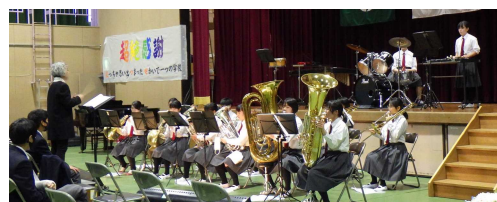
閉校記念行事実行委員会が中心となり、心に残る記念行事が開催されました