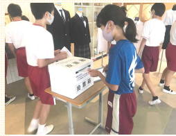
六瀬中学校での展示会と投票 7/1～7/5