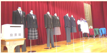
楊津小学校での展示会と投票 6/28～6/30