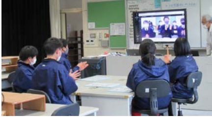
六瀬中学校 生徒会役員