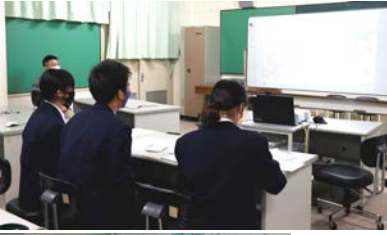
中谷中学校 生徒会役員