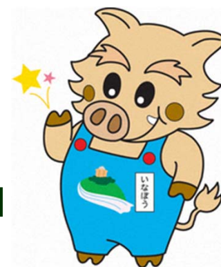
猪名川町マスコットキャラクター 「いなぼう」