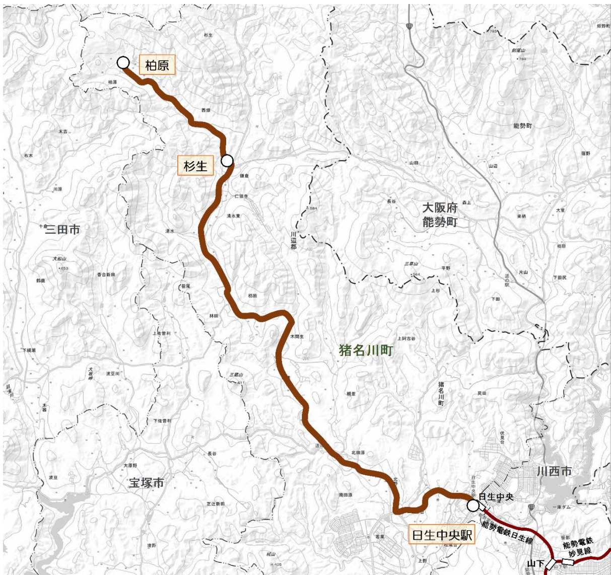
※国土地理院地図をベースに作成