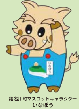
猪名川町マスコットキャラクター いなぼう