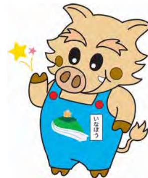
猪名川町マスコットキャラクター 「いなぼう」