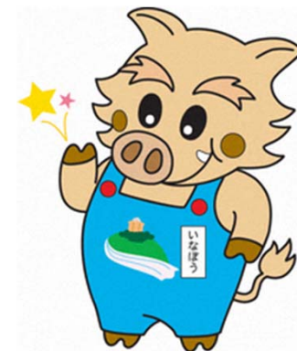
猪名川町マスコットキャラクター 「いなぼう」