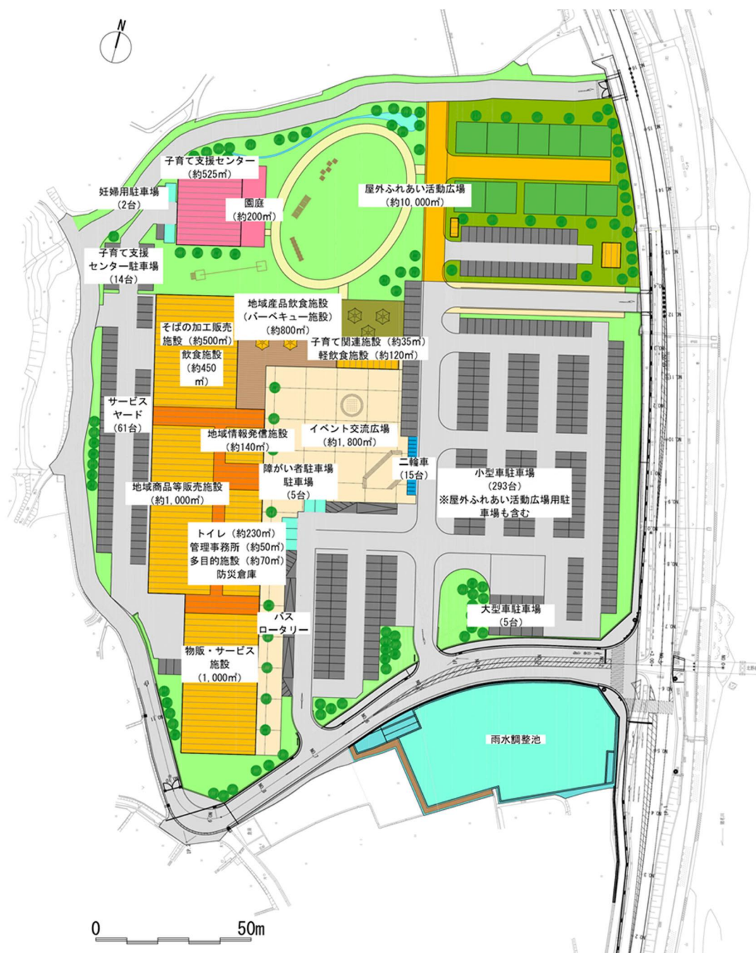
図 ゾーニング計画