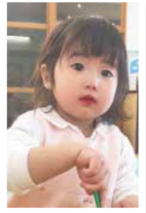
莉珠ちゃん(1歳7か月) 3番目の末っ子で甘えん坊! 兄と姉と共にいっぱい成長していったね!