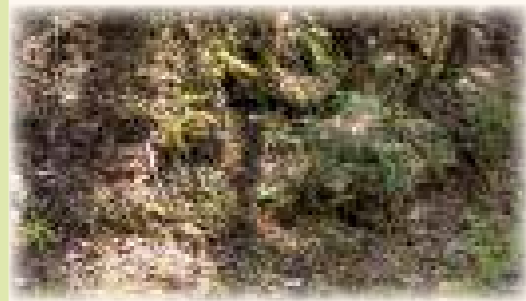
悠久の館から青木間歩まで歩きます♪