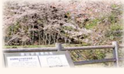
道中は鳥の鳴き声が聞こえたりと、自然が豊かでとってもきれいです