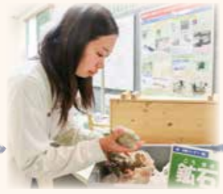
体験コーナーで鉱石を触ることができました