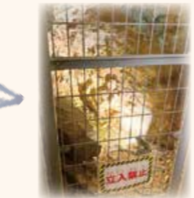
かつての採掘現場を見ることができました