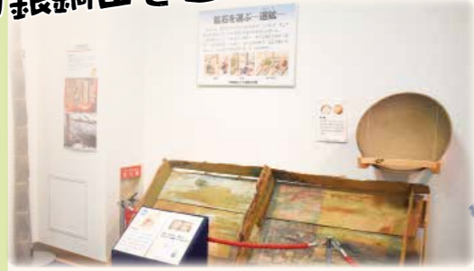
まず悠久の館の中で、多田銀銅山の歴史を学ぼう！