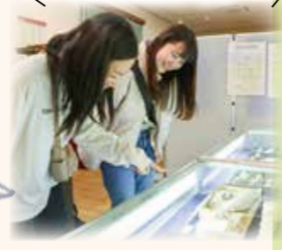
鉱石から顔料が!? 顔料について学べます