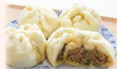
(エネルギー 355kcal、食塩相当量 1.8g)

寒さにあたるとうま味を増すねぎ。緑色の葉の部分は、β-カロテンが豊富で、皮膚や粘膜の健康を保ち、細胞の老化も防いでくれます。白い根の部分に含まれるアリシンには、血行を良くして体を温める効果があります。今回はねぎを使ったぎょうぎ風味の肉まんを紹介!