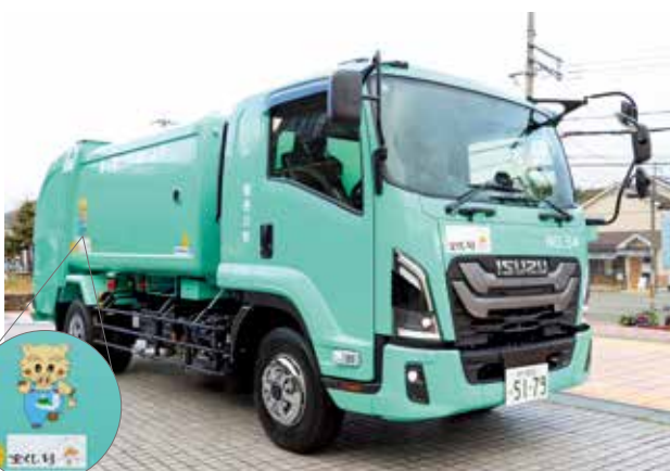
▲(公財)兵庫県市町村振興協会(宝くじ)の交付金を財源としたパッカー車(塵芥車)が、町クリーンセンターに納車されました。宝くじは、県内で購入を！