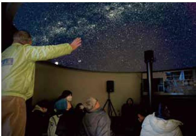
▲皆様からのご支援を受け、猪名川天文台プラネタリウムがリニューアル！寄附者への感謝の気持ちを込めて、ファーストライト&特別観望会を実施しました。