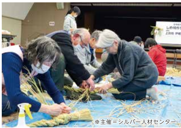
▲社会福祉会館で、女性部による「しめ縄づくり講習会」を開催。参加者同士助け合い、和気あいあいと楽しみながら心をこめて作りあげました。