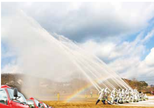
▲消防出初式を開催。観閲行進や消防団員による一斉放水を行い、高く上がる水柱と虹に大きな歓声があがりました。