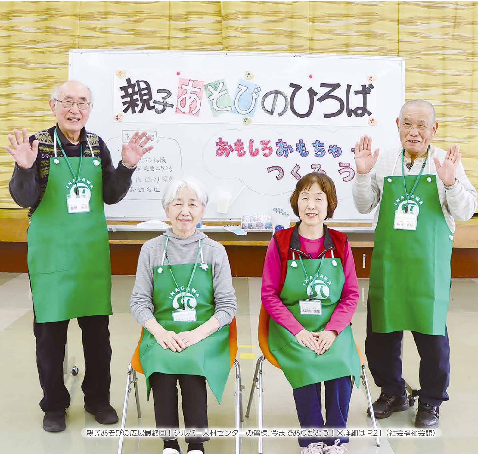
親子あそびの広場最終回！シルバー人材センターの皆様、今までありがとう！※詳細は P.21（社会福祉会館）