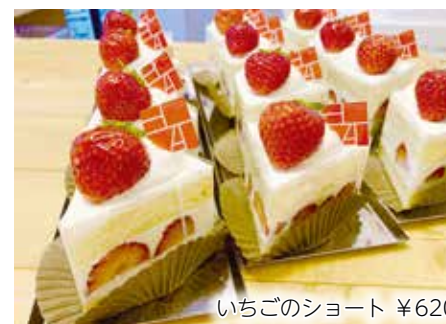
いちごのショート ¥620