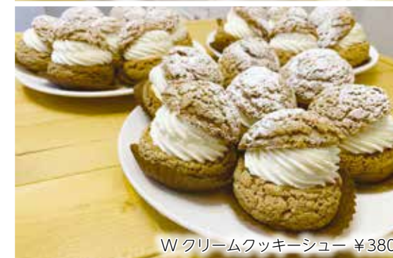
W クリームクッキーシュー ¥380