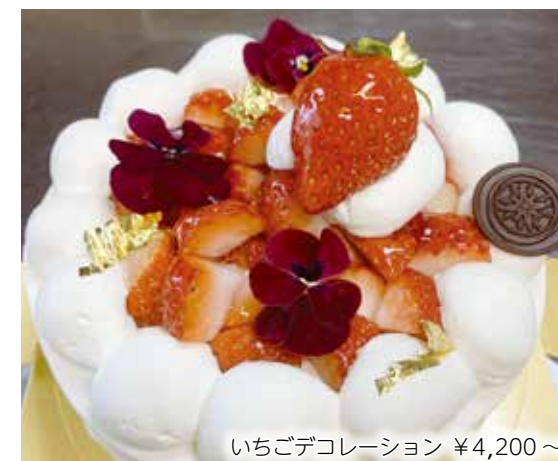
いちごデコレーション ¥4,200～

これからも、より多くの方に親しまれ、世代を問わず通っていただけるお店を目指してまいります。皆様のご来店、心よりお待ちしております。