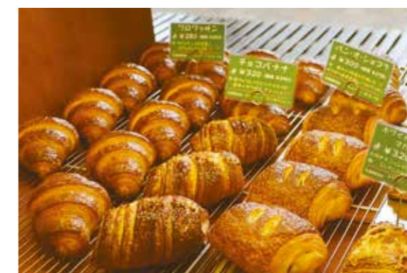
人気 No.1 の「クロワッサン」、チョコや果物を使った甘系・フランクフルトを巻いた総菜系など種類もたくさん