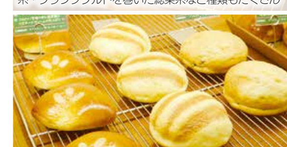
濃厚なカスタードがたっぷり入った「クリームパン」や、サクサク・ふわふわ食感の「メロンパン」も大人気