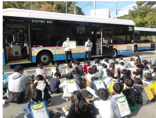
↑阪急バスでのMM教育事業