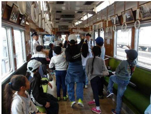
↑能勢電鉄でのMM教育事業