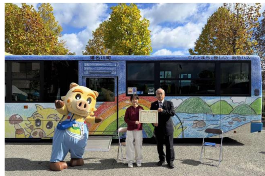
↑バスラッピングデザインコンペ表彰式