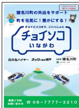
↑エリア拡大版パンフレット