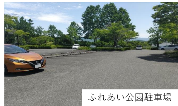
ふれあい公園駐車場