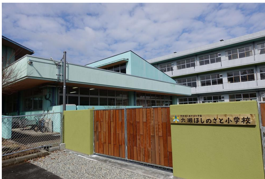
学校設置が認可され、校名板が設置された。