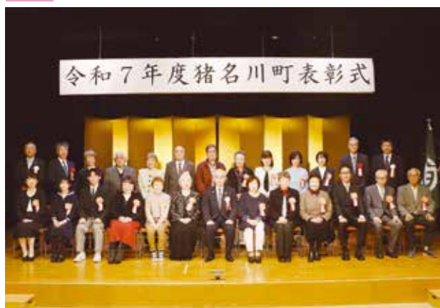
▲文化体育館で、令和7年度町表彰式を開催。福祉行政やスポーツなど、様々な分野で町に対する功績があった人や企業を表彰しました。