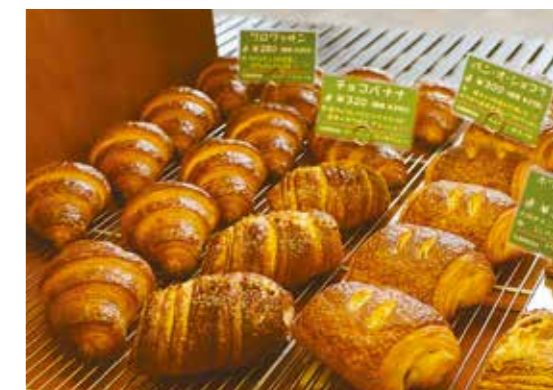
人気 No.1 の「クロワッサン」、チョコや果物を使った甘系・フランクフルトを巻いた総菜系など種類もたくさん