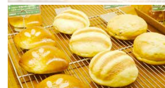
濃厚なカスタードがたっぷり入った「クリームパン」や、サクサク・ふわふわ食感の「メロンパン」も大人気