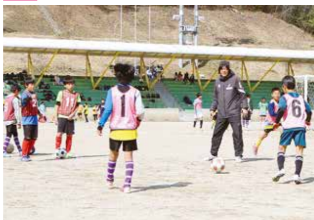
▲スポーツセンターで、町内小学生を対象に「ヴィッセル神戸サッカー教室」を開催。こどもたちはプロコーチの指導を受け、真剣な表情で練習に取り組んでいました！