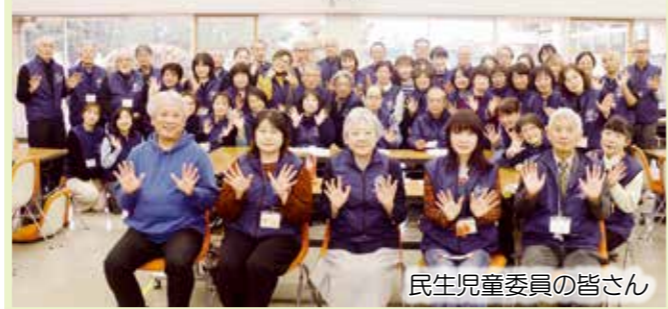
民生児童委員の皆さん

現在、下記の4つの地域で民生児童委員の担い手が不足しています。 ※松尾台サウンズビルE・F・G棟、白金2丁目62～91、つつじが丘4丁目、旭ヶ丘