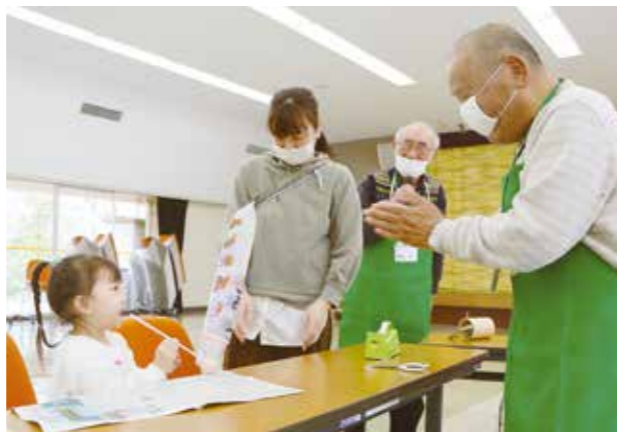
▲シルバー人材センター「親子あそびの広場」が開催され、こどもたちが工作に挑戦！惜しまれつつ最後の開催となったこの日、参加者からはたくさんの感謝の声が溢れました。