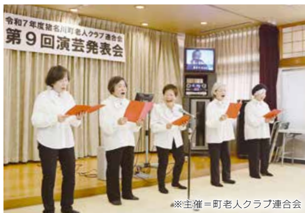
▲ゆうあいセンターで「第9回演芸発表会」が実施され、18組の参加者が歌や踊り、演奏を披露。客席からの温かい声援に包まれ、笑顔あふれるステージとなりました。