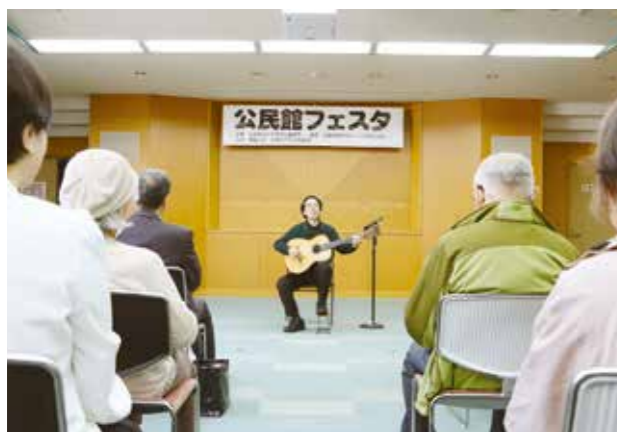
▲中央公民館で、公民館フェスタを開催。音楽や絵画、写真、工芸など、様々な活動をされている公民館登録グループの皆様が日頃の成果を発表しました！