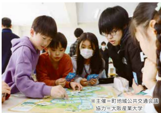
▲つつじが丘小学校・猪名川小学校で、公共交通が持つ役割や課題について知ってもらうための特別授業を実施。「いながわ交通すごろく」で楽しみながら学習しました。