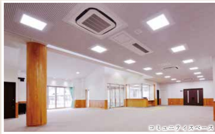
コミュニティスペース