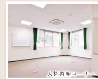
人権啓発コーナー