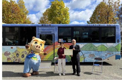
↑バスラッピングデザインコンペ表彰式