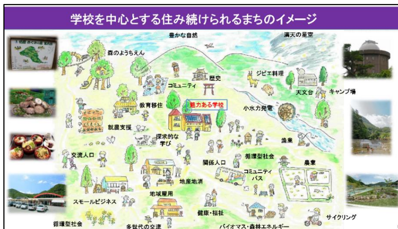
事業イメージ（一部抜粋）