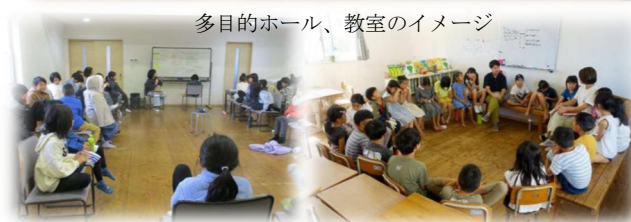
多目的ホール、教室のイメージ