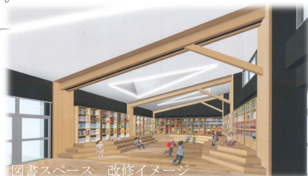
図書スペース 改修イメージ