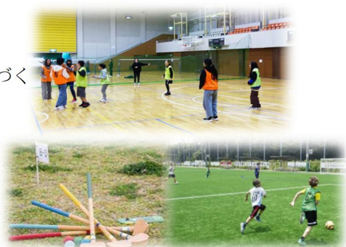
施設の地域開放イメージ