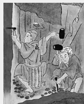
銀や銅を掘っているようす