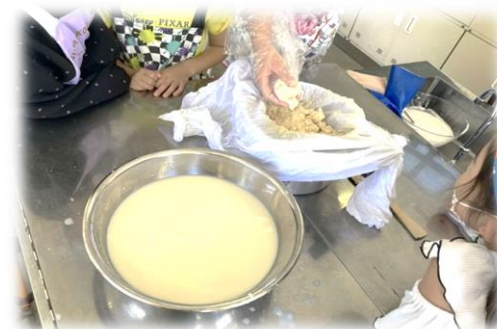
ぎゅっとしぼって豆乳とおからに!