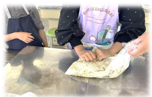
袋の中におから・砂糖・黒ごま・油・ホットケーキミックスを入れてもみもみ...