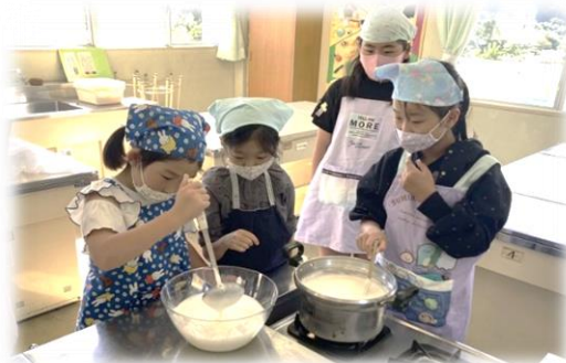
泡をていねいにすくっています。

国語の単元「すがたをかえる大豆」と絡めて、お豆腐作りをしました。前日から大豆を水に浸し、大豆をミキサーにかけるところからお豆腐作りのスタート!途中でできたおからも、クッキーにいただきました。古くから食べられてきた日本人には欠かせない大豆、そして大豆からできるたくさんの食べ物をこれからも大切にしていきたいですね。