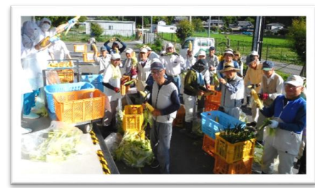
生産者の皆さんと皮むき作業

とうもろこしは日中に蓄えた養分が夜に糖へ変わるため、糖度が最も高い早朝の収穫が一番甘くなります。夜が明けて間もない早朝から収穫していただき、給食センターで茹でます。お楽しみに!!