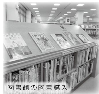
図書館の図書購入