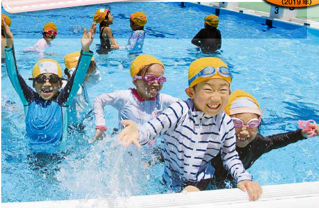
プールの授業に大はしゃぎ!友達と一緒に楽しいな♪(松尾台小学校)