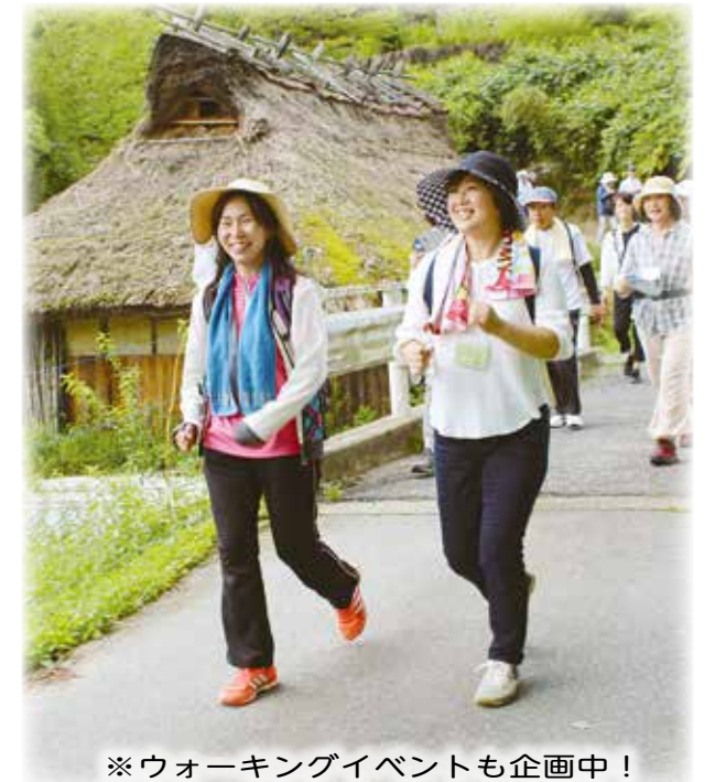
※ウォーキングイベントも企画中!

100日間(約3カ月)で100万歩のウォーキングにチャレンジして健康に! ▽期間 9月15日(日)～12月23日(月)の100日間 ▽対象 町内在住・在勤の18歳以上の人 ▽定員 先着300人 ▽コース設定 ①100万歩コース(1日1万歩目安) ②75万歩コース(1日7千500歩目安) ③50万歩コース(1日5千歩目安) ▽達成賞 目標達成した参加者には町スポーツセンタールのトレーニングルーム利用券2回分を進呈