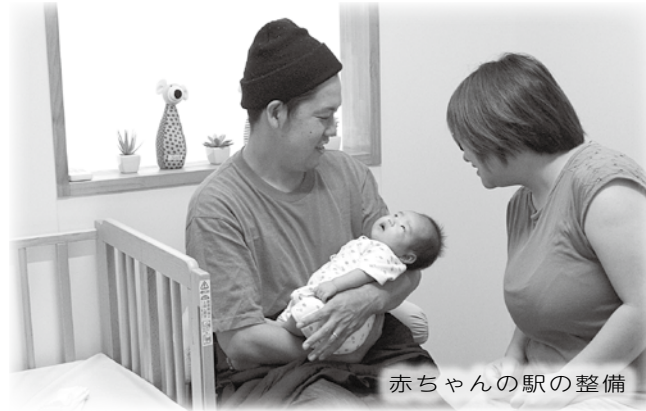
赤ちゃんの駅の整備