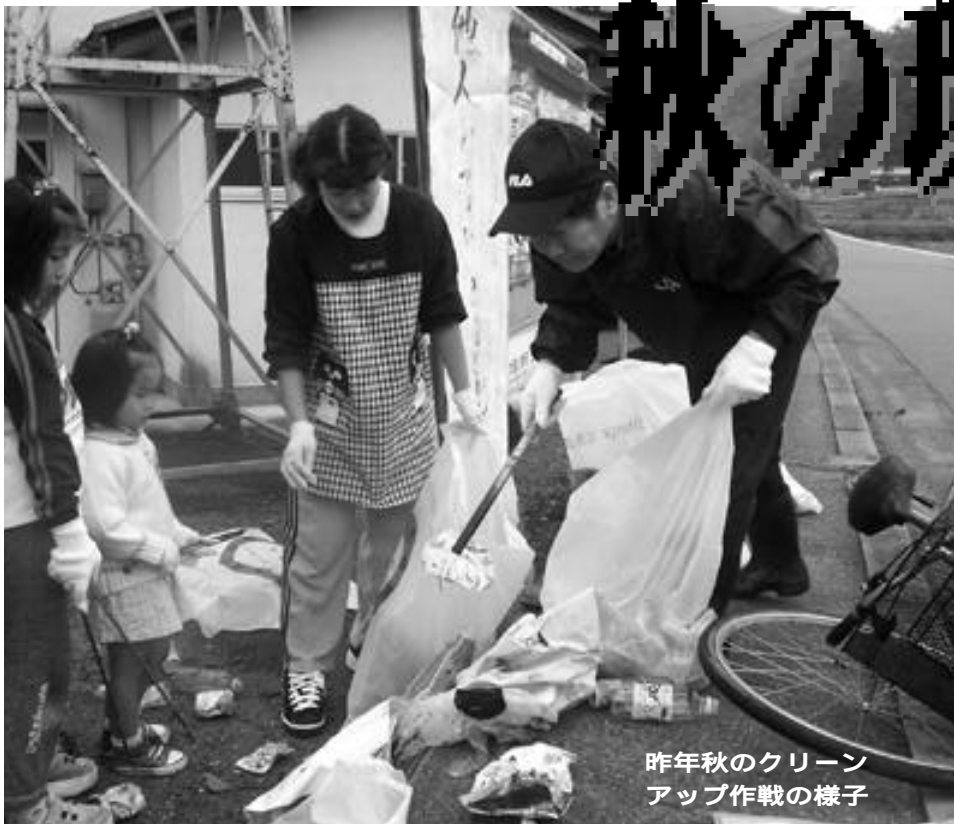
昨年秋のクリーンアップ作戦の様子