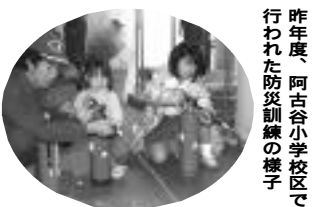
昨年度、阿古谷小学校区で行われた防災訓練の様子

猪名川町では、昨年度より各自治会に設けられている自主防災組織を中心として、地域の防災力の向上をめざした小学校区毎の体験型の防災訓練を実施しています。 本年度は楊津小学校区において、次の要領で実施します。地域の皆様はぜひご参加ください。 とき 10月29日(土)午後1時30分～ ところ 楊津小学校グラウンド(雨天の場合は、同校体育館) 内容 マグニチュード7クラスの大地震が発生したことを想定し、地域住民による各種訓練を実施 自宅から避難所までの避難誘導訓練