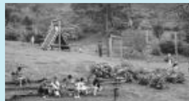
大野アルプスランド(天文台を含む)