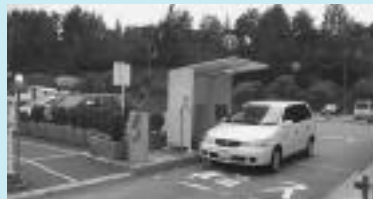
日生中央駅前交通広場駐車場