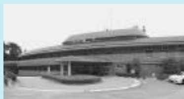
総合福祉センター