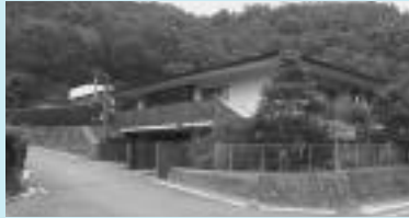
猪名川町自転車等駐車場

猪名川町自転車等駐車場・日生中央駅前交通広場駐車場は、平成18年4月1日から指定管理者の施設管理を行います。公募については、10月17日から行います。くわしくは、町ホームページをご覧ください。なお、豊照苑は、指定管理者で施設管理を行いますが、募集時期などは追ってお知らせします。