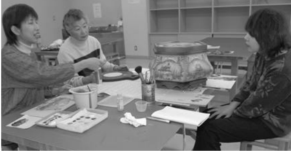
中央公民館の工作室でトールペインティングを楽しむ皆さん

中央公民館は、平成8年3月に公民館と図書館を併設した生涯学習センターの2階に開設され、生涯学習の拠点施設として活動中です。 ここでは、幅広い年齢層の多くの皆さんが日々、仲間同士で多彩な活動を展開しています。 公民館グループでは、随時メンバーを募集し見学も受け付けています。きっと新しい友人と新しい自分が発見できます。皆さんも一緒に活動してみませんか。