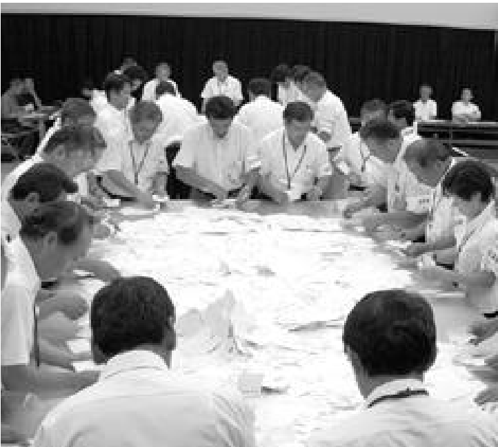
あなたの貴重な一票を、町政に生かしましょう

任期満了に伴う猪名川町議会議員選挙は、9月18日(火)に告示され、9月23日(日)が投票日となります。 この選挙は、私たちの暮らしや今後のまちづくりに大きく関わる大切な選挙です。各候補者の経歴や抱負などを掲載した選挙公報をよく読むなど公約を確認し、みんなそろって投票しましょう。 今回の町議会議員の定数は、前回より2人減の16人となっています。