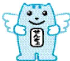
明るい選挙 イメージキャラクター 「選挙のめいすいくん」