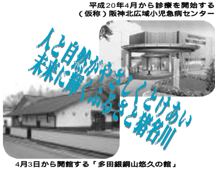
4月3日から開館する「多田銀銅山悠久の館」

人や文化とふれあいながら、自分らしく生きる心と体を育む教育文化のまちづくり 《新規事業》 多田銀銅山悠久の館の運営事業 7,030千円 町の重要な産業史跡である多田銀銅山遺跡関係資料の保存ならびに展示を行い、多田銀銅山の歴史と町の歴史・文化・自然を広く知らせ、気軽に接してもらうことを目的に整備した、悠久の館の有効な運営管理に努めます。 文化体育館施設整備事業 26,535千円 平成3年に開館以来16年を経過し、経年劣化による大ホールの音響設備などの改修工事を実施します。 屋内温水プール・屋外プール運営事業 14,591千円 町B & G海洋センター(屋内温水プール)ならびに南北プールは、新たに一体的に指定管理者制度を導入し、サービスの向上と効率的な運営管理を進めます。また、屋内温水プールは、引き続き、親子・幼児・小学生・ボディー・アクアビクスなどの水泳教室を開催するとともに、多目的室の活用による軽運動プログラムの実施を含め、住民の健康や体力づくりの一層の増進と、住民相互の交流の場づくりに努めます。 スクールアシスタント配置事業 1,833千円 ADHD(注意欠陥多動性障害)などにより行動面で課題のある児童が在籍する小学校の通