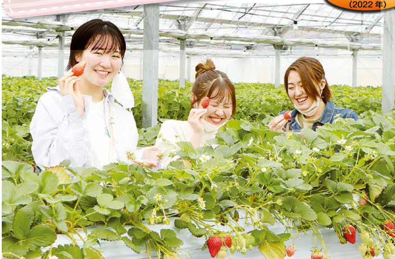
町内産のあま〜いいちごと、はじける笑顔(槻並)