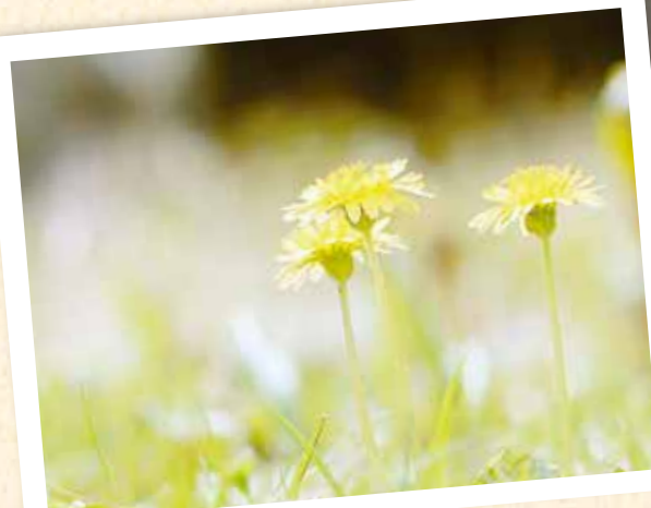
春の日差しを浴びて…「ニホンタンポポ」(上野)