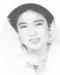
キム・ヨンジャさん

NHK素人のど自慢の公開録音を9月22日に行います。出場申込みと観覧の申込みは次のとおりです。 当日は、歌手の堀内孝雄さんとキム・ヨンジャさんをゲストに迎え、楽しい番組を繰り広げます。ご参加ください。 出場の申込み 往復はがき(1人1枚)に住所・氏名・年齢(16歳以上)・職業・性別・歌う曲目(1曲)電話を必ず記入し、8月20日必着で社会教育課「NHKのど自慢」出場係へ。 観覧の申込み 往復はがき(1人1枚)に住所・氏名・年齢・電話を必ず記入し、8月20日必着で、社会教育課「NHKのど自慢」観覧係へ。出場・観覧とも応募多数の場合抽選。 なお、予選は9月21日午後1時イナホールで行います。詳細は、文化体育館準備室(☎66・3238)へ。