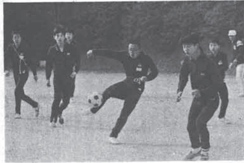
教育を中心に編成された新年度予算

それぞれ六十万円を追加し総額をそれぞれ三億二千四百六十万円としたもの。 ▽昭和五十二年猪名川町猪名川流域下水道事業特別会計補正予算(第一号) 一歳入歳出予算の総額に歳入歳出それぞれ一千八百四十四万三千円を追加し、総額をそれぞれ一億七千九百六十六万三千円としたもの。 ▽昭和五十二年猪名川町