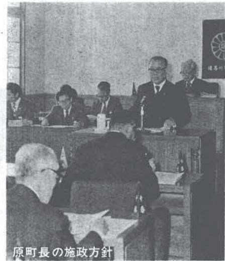
原町長の施政方針

4月1日現在 人口 9,494 (先月より33人増) 男 4,715 女 4,779 世帯数2,333(先月より7世帯増) 面積 90.19ha 人口密度 105人/ha