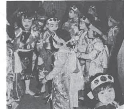
“ねりこみ” 杉生 10月16日、17日は、町内各地で秋まつりが行われました。杉生八坂神社の秋まつりは、江戸末期から継承されている“ねりこみ”。3歳から中学生までの子どもたちが、歌舞伎の志田蔵の各場面を演じながら町を練る独特なもの。

在職(実在職年数が下士官以下十二年准士官以上は十三年以上)の老令者などの普通恩給や普通扶助料の年額計算の算出率の改善など