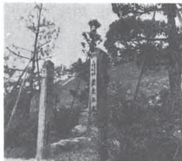
旧校舎の楠木などを集めた歴史の庭

現在の児童・園児数約四百名、先生は二十三名。教育目標は「ひとりひとりの能力・適性を最大限に伸ばし、知・情・意・体の調和のとれた全人教育を行い、民主的・社会的な基盤を培う」としている。今年度は主体的な生活態度と仲間づくりを進めるため、一年・六年生を縦で割り、二十五班にわけ清掃作業を行っている。そのグループで週一回グループ遊びも行なう。また一人一鉢運動というユニークな活動も注目される。